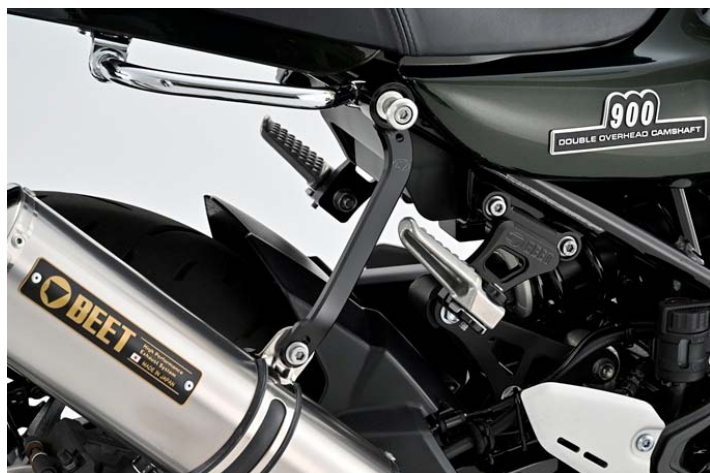
専用タンデムキットとサイレンサーステー付属