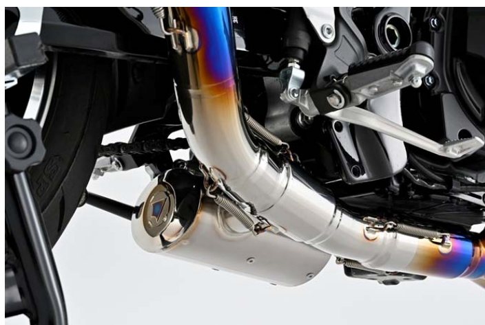
BLSS 2 (BACK LOADED SUB SILENCER) システム採用