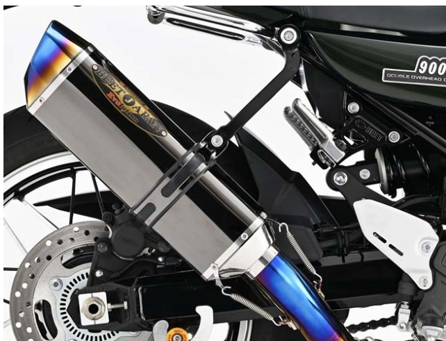
専用タンデムキットとサイレンサーステー付属