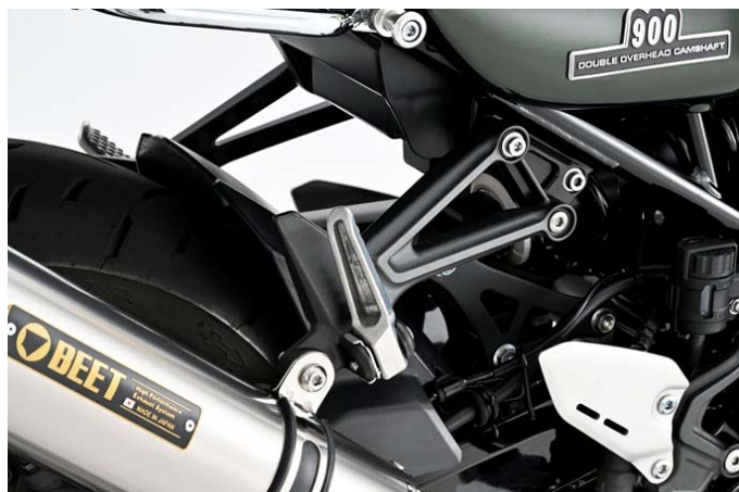
専用タンデムオフセットステー付属