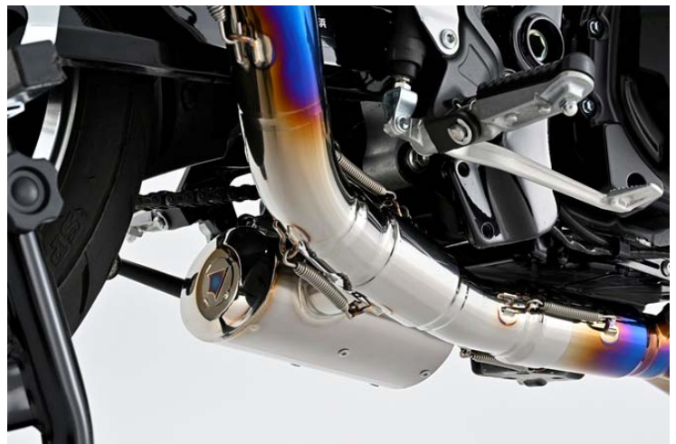
BLSS 2 (BACK LOADED SUB SILENCER) システム採用